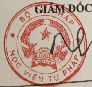
Đoàn Trung Kiên